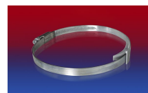
CLAMP 210 BRIDGE CLAMP

La sovrappressione e la sottopressione sono valori limite di funzionamento raccomandati, i prodotti possono essere sottoposti a carichi maggiori su richiesta. Il raggio di curvatura è misurato attraverso l'interno dell'arco del tubo. Ci riserviamo il diritto di apportare modifiche tecniche. Tutti i valori sono determinati a 20°C e sono dati approssimativi. Ulteriori informazioni su norres.com/it/tecnologia/ .