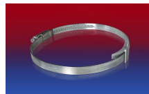
CLAMP 210 BRIDGE CLAMP

Les pressions et dépressions sont des valeurs recommandées en seuil de fonctionnement; les produits peuvent être soumis à des valeurs plus élevées sur demande. Le rayon de courbure est mesuré à partir de l'axe de la gaine. Tout droit d'apporter des modifications techniques est réservé. Toutes les valeurs déterminées sont données à une température de 20 °C environ. Données techniques complémentaires sur: www.norres.com/fr/technologie/ .