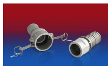
CONNECT KAMLOK ALU 253