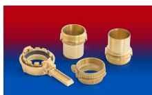
CONNECT TANK TRUCK BRASS 252