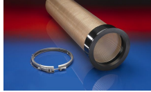
CONNECT 245 VAC- TRUCK

Nad i podciśnienie są zalecanymi eksploatacyjnymi wartościami granicznymi, na specjalne zamówienie produkty mogą być poddawane wyższemu obciążeniu. Promień gięcia mierzony na wewnętrznej stronie gięcia węży. Zastrzega się prawo do dokonywania zmian technicznych. Wszystkie wartości pomierzone w temperaturze 20 °C i są one wartościami przybliżonymi. Dalsze dane techniczne są dostępne na stronie www.norres.com/pl/technika/ .