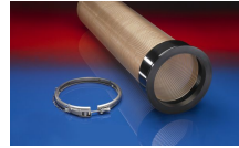
CONNECT 245 VAC- TRUCK