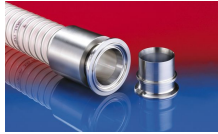
CONNECT PRESS ASSEMBLY 232