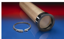
CONNECT 245 VAC-TRUCK