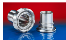
CONNECT ASEPTIC FITTING 249