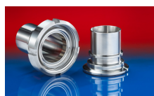
CONNECT ASEPTIC FITTING 249