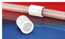
CONNECT 246 FOOD