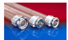
CONNECT SAFETY CLAMP ASSEMBLY 231