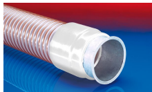
CONNECT 243 FOOD