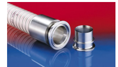
CONNECT TRI- CLAMP FITTING 245 ASSEMBLY 232