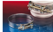
CONNECT MOULD ASSEMBLY 233