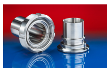
CONNECT ASEPTIC FITTING 249