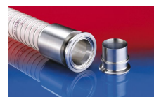
CONNECT PRESS ASSEMBLY 232