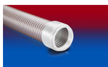
CONNECT 245 FOOD