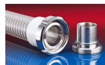
CONNECT Mould ASSEMBLY 233