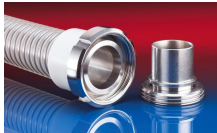
CONNECT MOULD ASSEMBLY 233