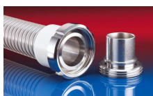
CONNECT MOULD ASSEMBLY 233