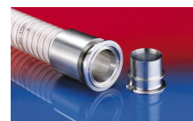
CONNECT PRESS ASSEMBLY 232

Při přetlaku a podtlaku doporučujeme dodržet hranici provozní hodnoty. Bližší informace o vyšším zatížení jsou dostupné na vyžádání. Poloměr ohybu je měřen podle vnitřního zahnutí hadice. Právo učinit technické změny je vyhrazeno. Všechny hodnoty jsou stanoveny při teplotě 20 °C a jsou jen přibližné. Další technické údaje jsou dostupné na www.norres.com/cz/technologie/ .