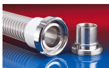
CONNECT MOULD ASSEMBLY 233