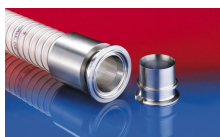
CONNECT PRESS ASSEMBLY 232