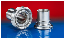
CONNECT ASEPTIC FITTING 249