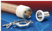
CONNECT TRI-CLAMP FITTING 245