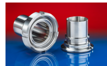
CONNECT ASEPTIC FITTING 249

Nad i podciśnienie są zalecanymi eksploatacyjnymi wartościami granicznymi, na specjalne zamówienie produkty mogą być poddawane wyższemu obciążeniu. Promień gięcia mierzony na wewnętrznej stronie gięcia węża. Zastrzega się prawo do dokonywania zmian technicznych. Wszystkie wartości pomierzono w temperaturze 20 °C i są one wartościami przybliżonymi. Dalsze dane techniczne są dostępne na stronie www.norres.com/pl/technika/ .