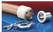
CONNECT TRI-CLAMP FITTING 245