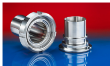
CONNECT ASEPTIC FITTING 249