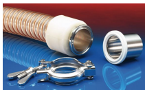
CONNECT TRI-CLAMP FITTING 245