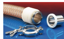
CONNECT TRI-CLAMP FITTING 245

Při přetlaku a podtlaku doporučujeme dodržet hranici provozní hodnoty. Bližší informace o vyšším zatížení jsou dostupné na vyžádání. Poloměr ohybu je měřen podle vnitřního zahnutí hadice. Právo učinit technické změny je vyhrazeno. Všechny hodnoty jsou stanoveny při teplotě 20 °C a jsou jen přibližné. Další technické údaje jsou dostupné na www.norres.com/cz/technologie/ .