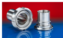
CONNECT ASEPTIC FITTING 249