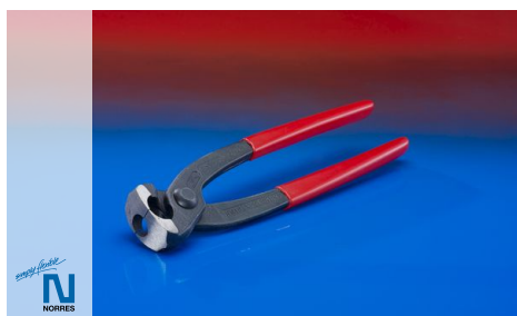
Pliers for assembly of one ear clamps