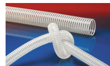
NORPLAST® PUR 385 AIRFLEX AS