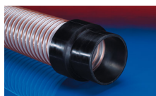
CONNECT 240 + 241