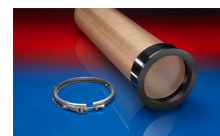
CONNECT 245 VAC-TRUCK