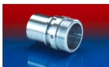
CONNECT THREAD FITTING 234