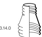
13.14.0 Warmshrumpfmuffe 223 Heat Shrink Sleeve 223

Weiteres Zubehör/further accessories: 13.6.0, 13.7.0